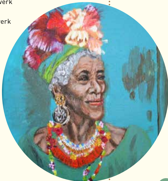
Werk van Monique van Putten