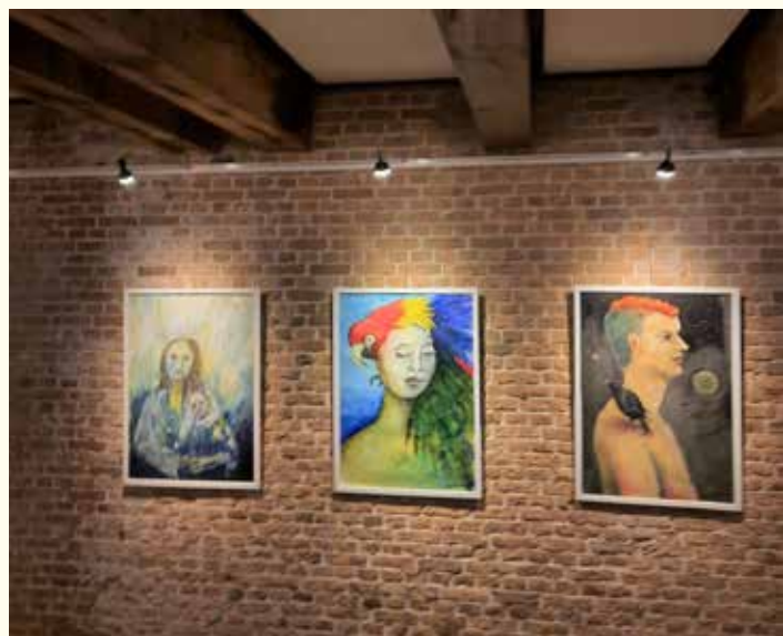
Werk van Gerry v.d. Heijden