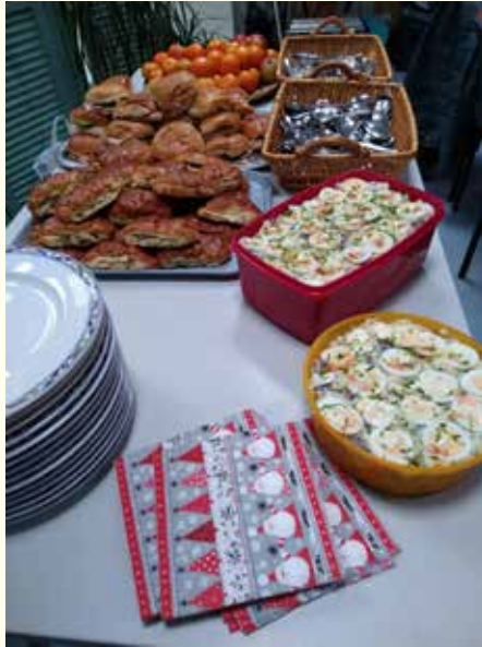
Eten met de kerst