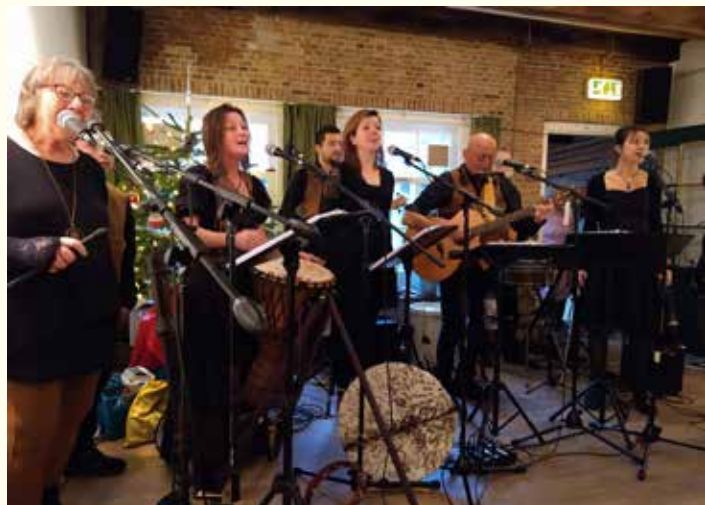
Optreden muziekgroep Jun tijdens kerst