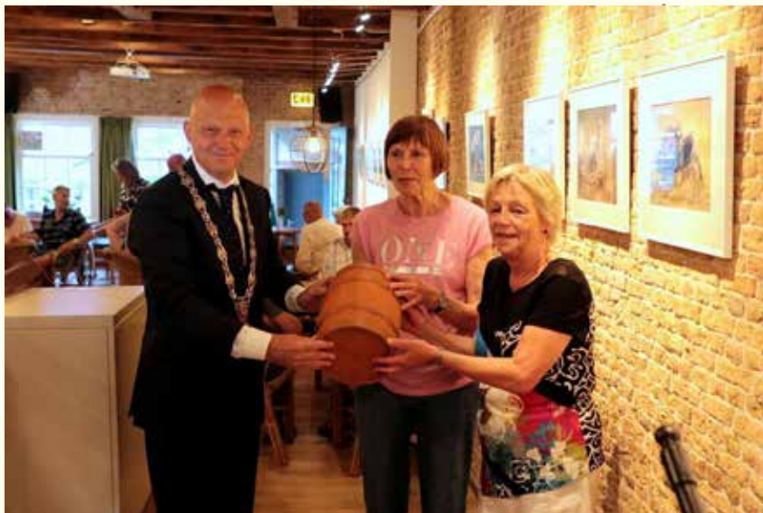
Haring ontvangen van de burgemeester

De kerstdagen konden gelukkig ook weer gevierd worden. Al weken voor de kerst werd door gasten gevraagd of de familiemuziekgroep 'Jun' (onze 'huisband') echt weer zou gaan optreden. In een goed bezet aanloophuis kon de familie weer op eerste kerstdag zingen en muziek maken. De gasten en vrijwilligers genoten als vanouds. Zoals te doen gebruikelijk was er weer van alles te eten. Het was echt feest! Tweede kerstdag was ook een drukke en gezellige dag met voldoende eten. Natuurlijk waren er met oud en nieuw weer traditioneel heerlijke oliebolletjes.