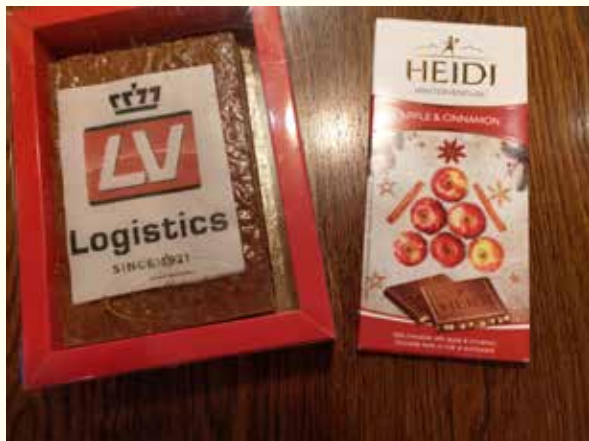
Cadeautjes in de brievenbus