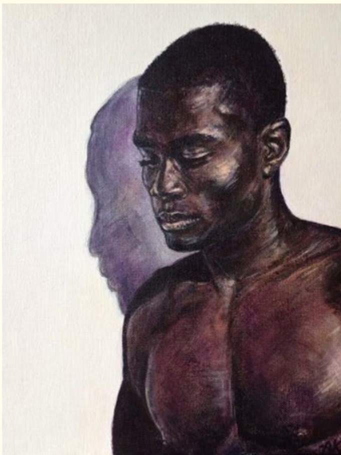
werk van Arjen Korpershoek

"Realistische werken van figuren en gezichten, teken en schilder ik het liefst. Modeltekenen en portretteren van mensen van verschillende rassen en culturen zijn en blijven heel inspirerend om mee bezig te zijn. In mijn werk spelen daarbij kleur en sfeer een belangrijke rol."