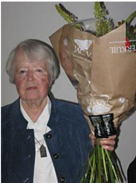
Ook werden er nog twee vrijwilligers extra in het zonnetje gezet die vanaf 1994 al die tijd trouw hun werk in het aanloophuis hebben gedaan.