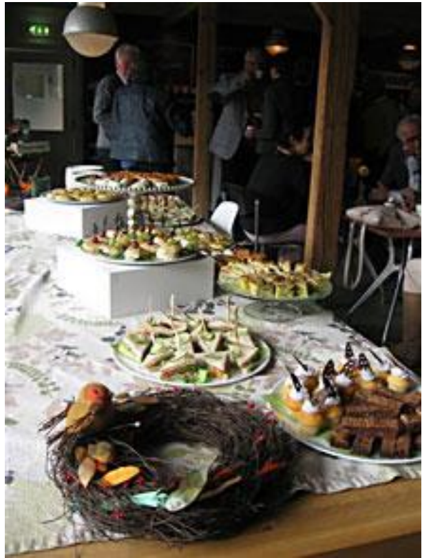
De hapjes waren feestelijk en meer dan heerlijk!